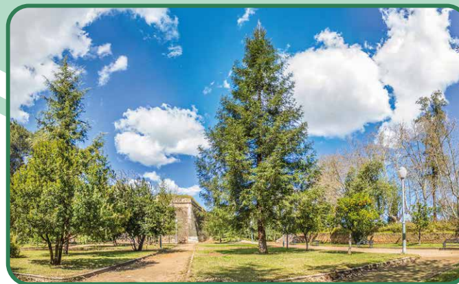
Jardins da Trindade.

Nos jardins da Trindade , perto das grandes bananeiras de sombra que ladeiam o exterior do baluarte de São Pedro, aparece um exemplar de Sequóia, árvore de origem americana de grande longevidade. Também se destaca a Árvore do paraíso ( Eleagnus angustifolia ) procedente da Ásia Central. O Ombu ou Bela-Sombra ( Phytolacca dioica ), com origem na Argentina e de grandes raízes visíveis. E um exemplar de Espinho-de-Jerusalém ( Parkinsonia aculeata ) originário do sul da América do Norte.