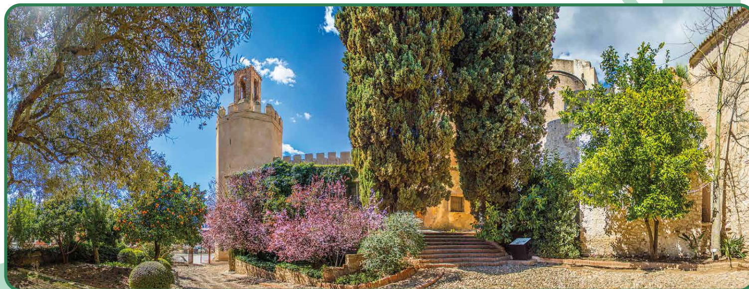
Jardins de La Galera.

Dentro do Parque infantil , encontramos a Koelreuteria paniculata , originária da Ásia Oriental, com belas flores amarelas. O Ácer-da-Noruega ( Acer platanoides ) procedente do Norte e centro da Europa. Ou a Tipuana ( Tipuana tipu ), da Argentina e Bolívia, com flores amareladas.